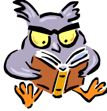
Resmi veya grafiği açıklayan alt yazı.

Bülteninize eklediğiniz içeriğin çoğu Web sitenizde de kullanılabilir. Microsoft Publisher, bülteninizi Web yayınına dönüştürmek için basit bir yöntem sunmaktadır. Böylece, bülteninizi yazmayı tamam-