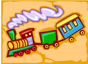
Resmi veya grafiği açıklayan alt yazı.

Makalenizi düşünün ve kendinize, resmin vermeye çalıştığınız iletiyi destekleyip destekle-