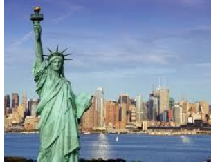
ABD ÖZGÜRLÜK HEYKELİ